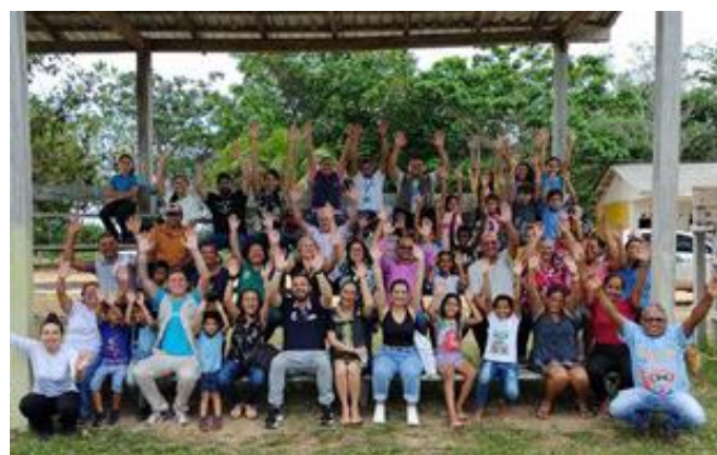
Projeto SaneaHRR: Parceria entre UNICEF e Funasa, Rorainópolis/RR – novembro, 2022.