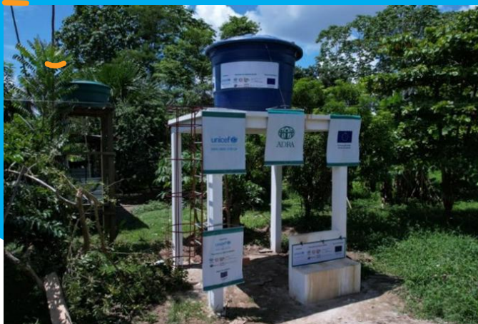
Solução alternativa coletiva de abastecimento de água para consumo humano (SAC) implantada em comunidade indígena do DSEI/ARS – dezembro, 2022.