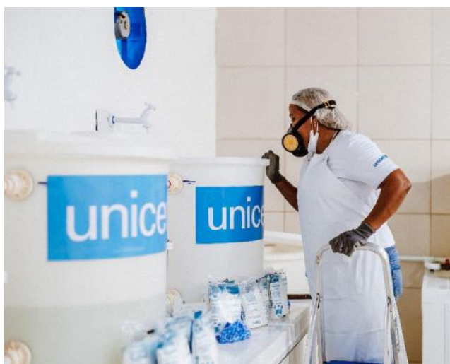
Produção de hipoclorito de sódio, distribuído em abrigos oficiais e assentamentos informais de Boa Vista/RR e Pacaraima/RR, Boa Vista/RR – junho, 2022.