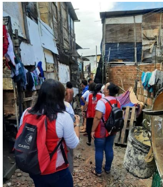
Avaliação dos impactos das chuvas intensas no estado de Pernambuco, em conjunto com a Caritas Brasil, Recife/PE – junho, 2022