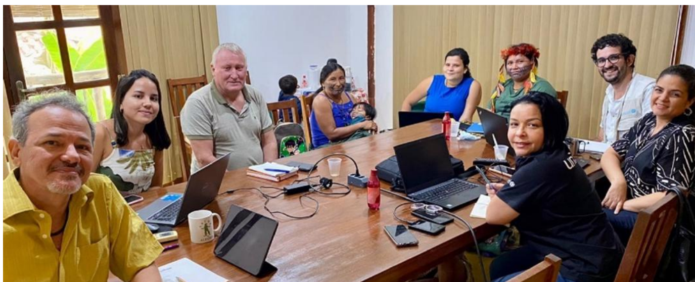
Reunião com a coordenação do PSA e lideranças indígenas do povo munduruku, Santarém/PA – junho, 2022.