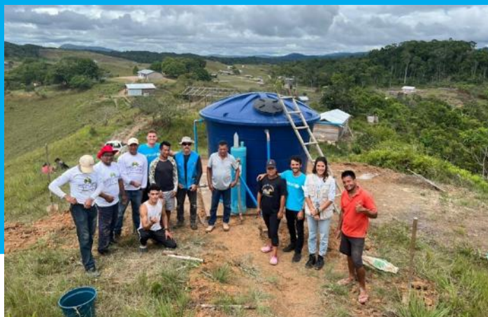
Sistema de tratamento e distribuição de água potável na comunidade Sakao-Mota da terra indígena São Marcos, em parceria com o CIR e DSEI-L/RR, Pacaraima/RR – janeiro, 2023.