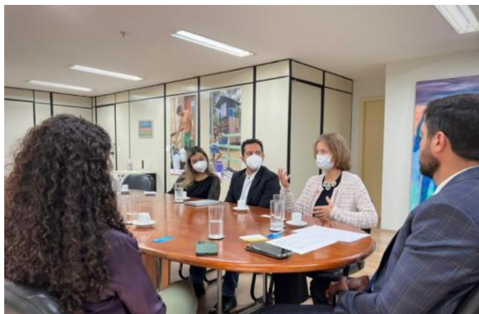
Reunião com o presidente e a diretoria da Funasa para formalizar a assinatura de Memorando de Entendimento entre as instituições, Brasília/DF – junho, 2022.