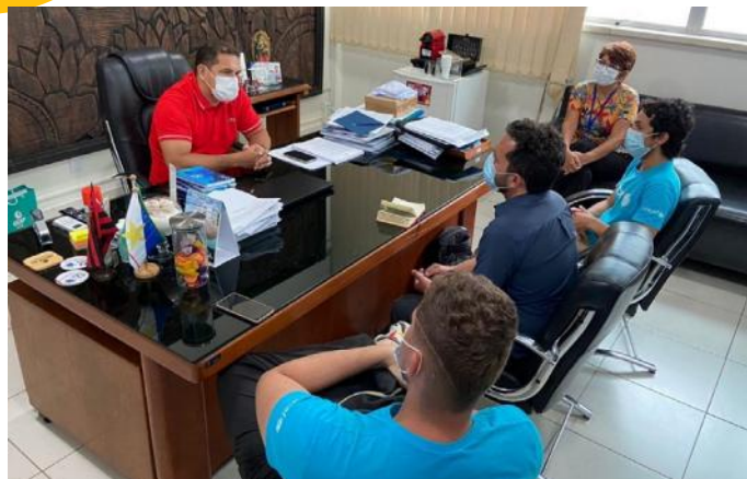
Reunião com o presidente da Caer para tratativas sobre o abastecimento de água em assentamentos informais onde vivem migrantes e refugiados venezuelanos, Boa Vista/RR – março, 2022.