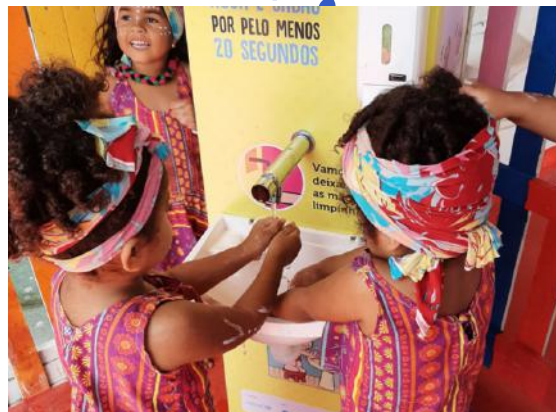
Escola Municipal Nedi Vovó Jovina, na Comunidade Remanescente Quilombola de Porteiras, Caucaia/CE – agosto, 2022.