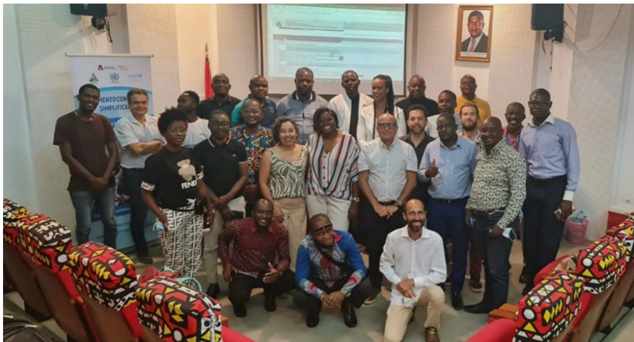
Missão Angola: Seminário para o compartilhamento de informações em WASH entre os governos de Brasil e Angola, Luanda – maio, 2022.