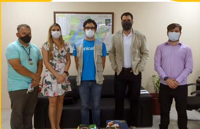
Reunião com o secretário estadual do Meio Ambiente e o presidente do Conselho Estadual de Recursos Hídricos do Estado do Amazonas, Manaus/AM – fevereiro, 2022.