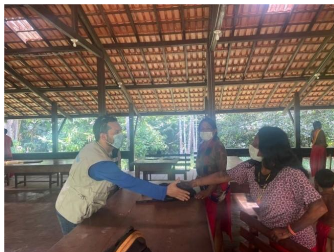
Visita técnica, realizada em conjunto com a Sesai/MS, ao DSEI/AMP, Macapá/AP – agosto, 2022.