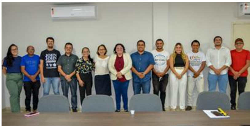
Reunião para apresentação do projeto WASH, parceria entre UNICEF e Funasa, Piripiri/PI – dezembro, 2022.