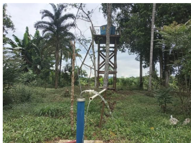
Melhorias de infraestrutura relacionadas ao abastecimento de água para consumo humano no DSEI/YAN – fevereiro, 2022.