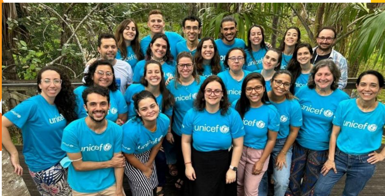
Equipe do EZ/Boa Vista e ETT, Boa Vista/RR– dezembro, 2022.