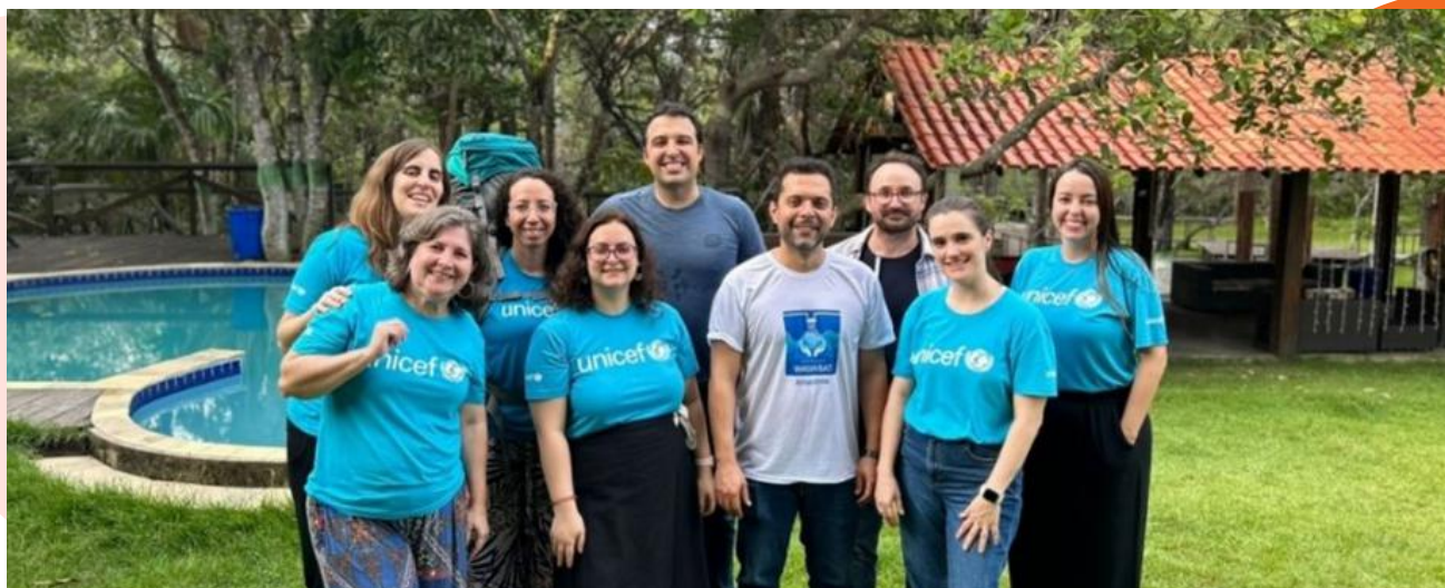
Equipe técnica de emergência (ETT) do UNICEF Brasil, Boa Vista/RR – dezembro, 2022.