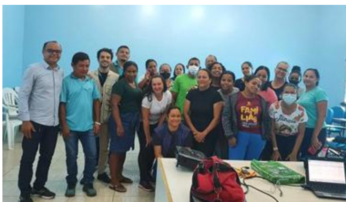
Projeto SaneaHRR: Capacitação em WASH para servidores municipais, parceria entre UNICEF e Funasa, Rorainópolis/RR – junho, 2022.