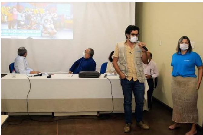
Apresentação da proposta de criação do CMSB ao prefeito e a todos os secretários do município de Belém/PA – março, 2022.