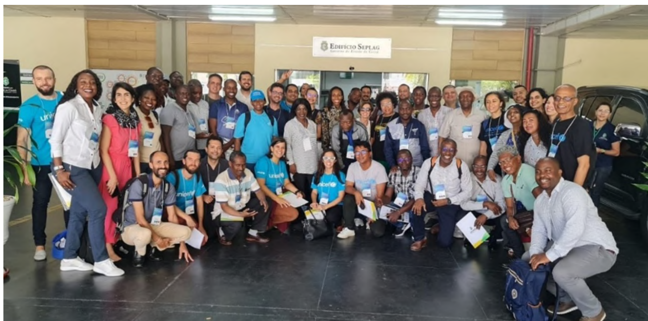
Missão Esaro: Visita à sede da SCidades do Governo do Estado do Ceará, Fortaleza/CE – novembro, 2022.