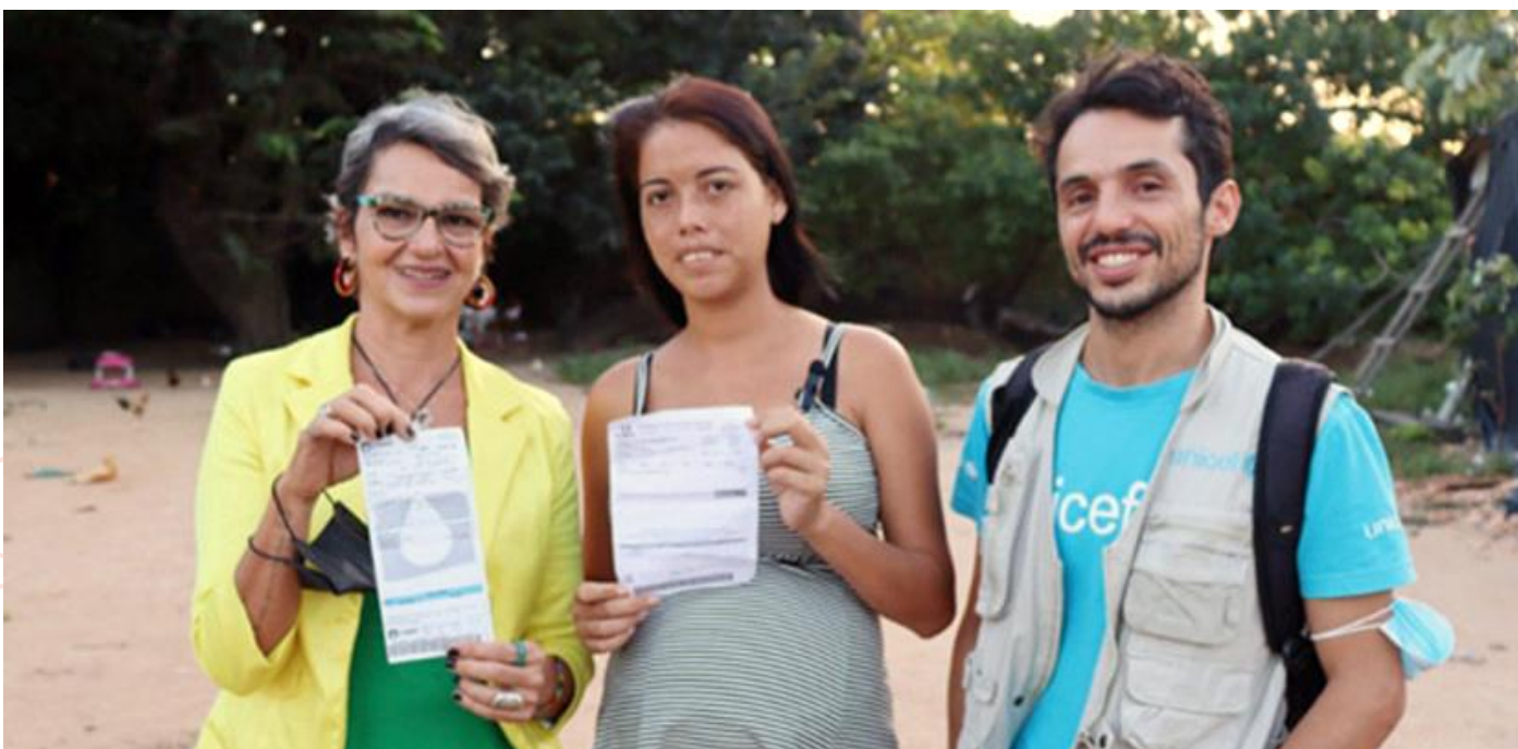
Articulação com DPE e Caer para ligação de assentamentos informais à rede pública de abastecimento de água para consumo humano, Boa Vista/RR – dezembro, 2022.