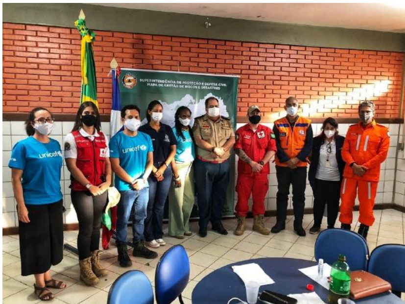
Missão de equipe do UNICEF Brasil em apoio ao desastre hidrológico no estado da Bahia, Ilhéus/BA – janeiro, 2022.