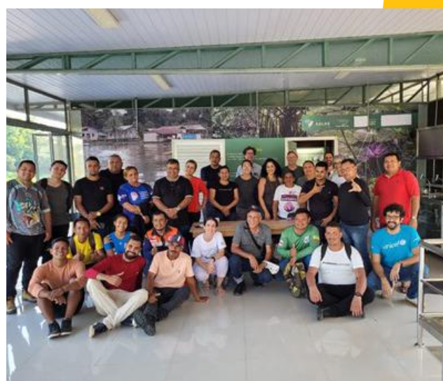
Debates para Gestão de Água, Esgoto e Energia na Amazônia, organizado pelo Instituto de Desenvolvimento Sustentável Mamirauá, Tefé/AM – novembro, 2022.