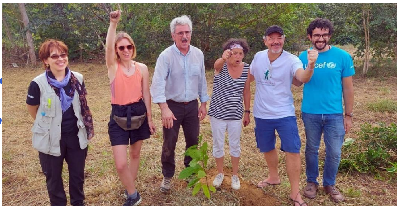
Encontro com deputados do Parlamento Europeu e representantes do PSA, Santarém/PA – julho, 2022.