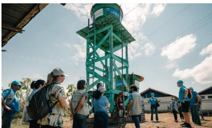
Visita de CEOs à comunidade Paraná de Terra Nova, localizada em área rural de Careiro da Várzea/AM – agosto, 2022.