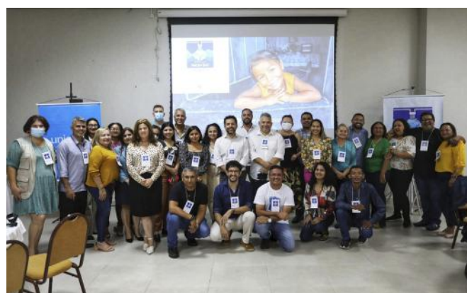
Workshop WASH BAT Amazônia, organizado pelo UNICEF Brasil e Siwi, Manaus/AM – dezembro, 2022.