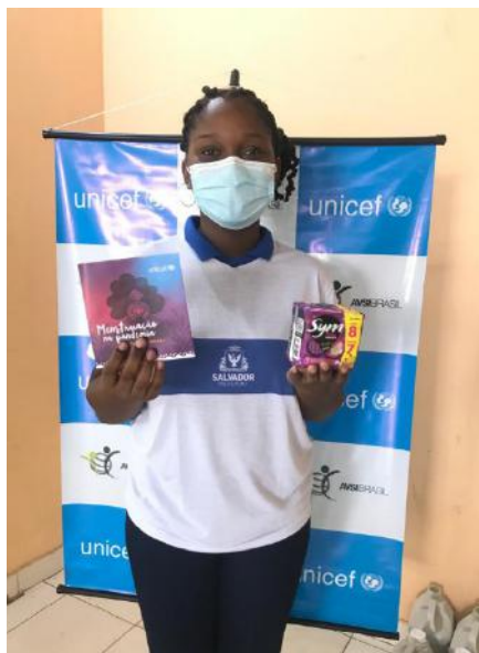
Aluna da Escola Municipal 15 de Outubro beneficiada com o kit de higiene menstrual, Salvador/BA – maio, 2022.