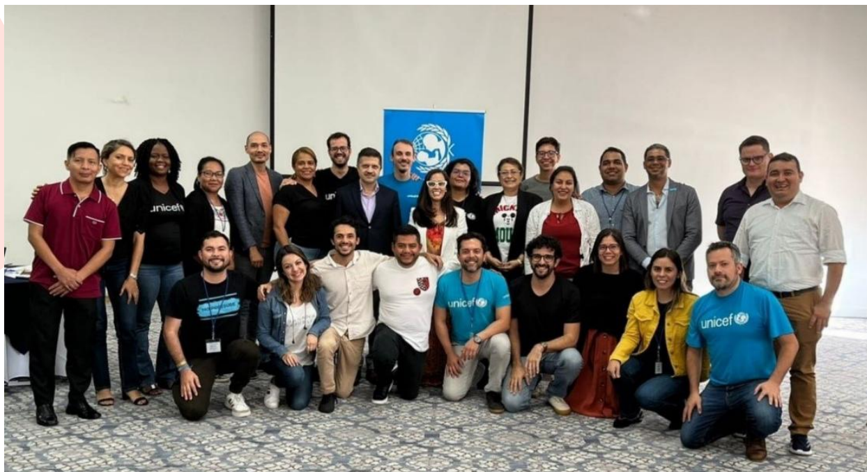
Treinamento WASH em Emergências organizado pelo Escritório Regional do UNICEF para a América Latina e o Caribe (Lacro), Cidade do Panamá – outubro, 2022.