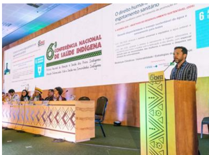
Apresentação realizada durante a 6ª CNSI, Brasília/DF – novembro, 2022.