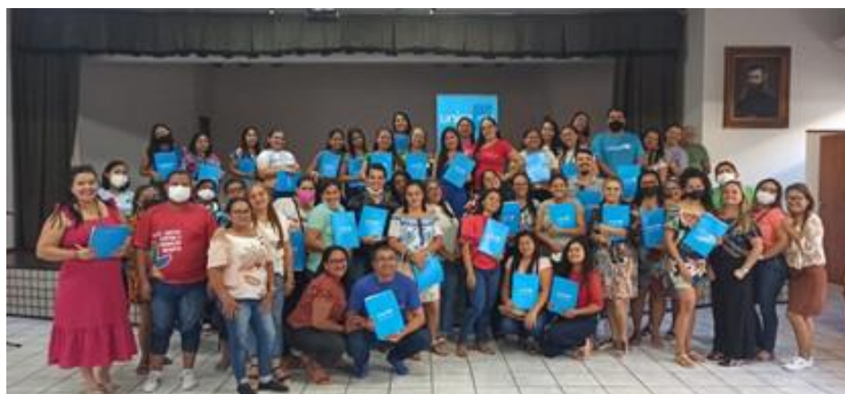
Capacitação de profissionais de educação em protocolos para a retomada das aulas e convivência segura nas escolas, Caucaia/CE – junho, 2022.