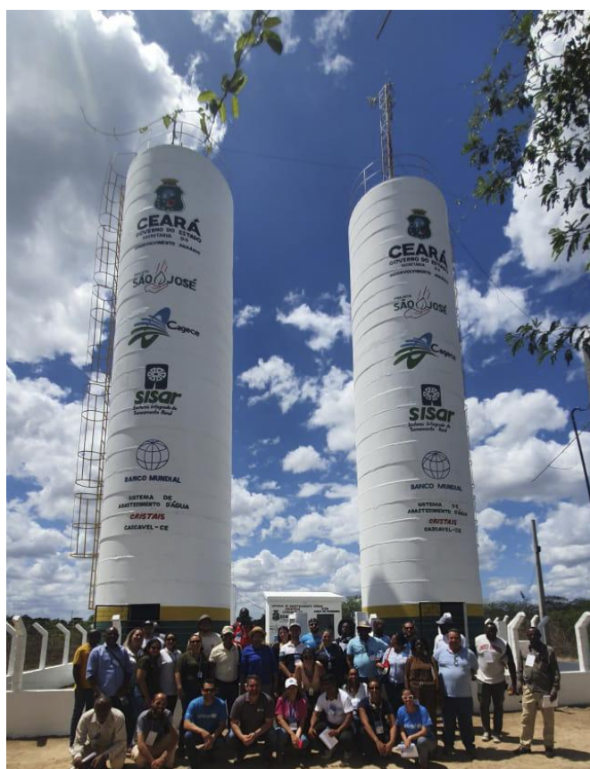
Missão Esaro: Visita ao Sistema Integrado de Saneamento Rural (Sisar), Cascavel/CE – novembro, 2022.