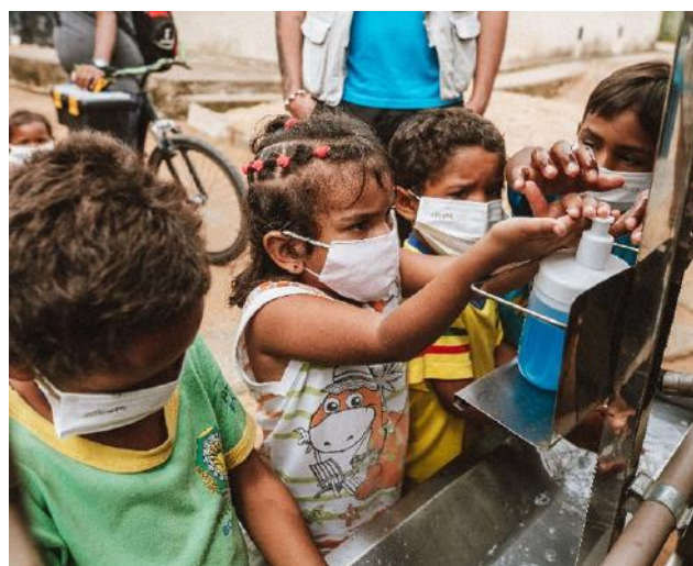
Oficina de lavagem de mãos no assentamento informal Monteiro Baena, Boa Vista/RR – agosto, 2022