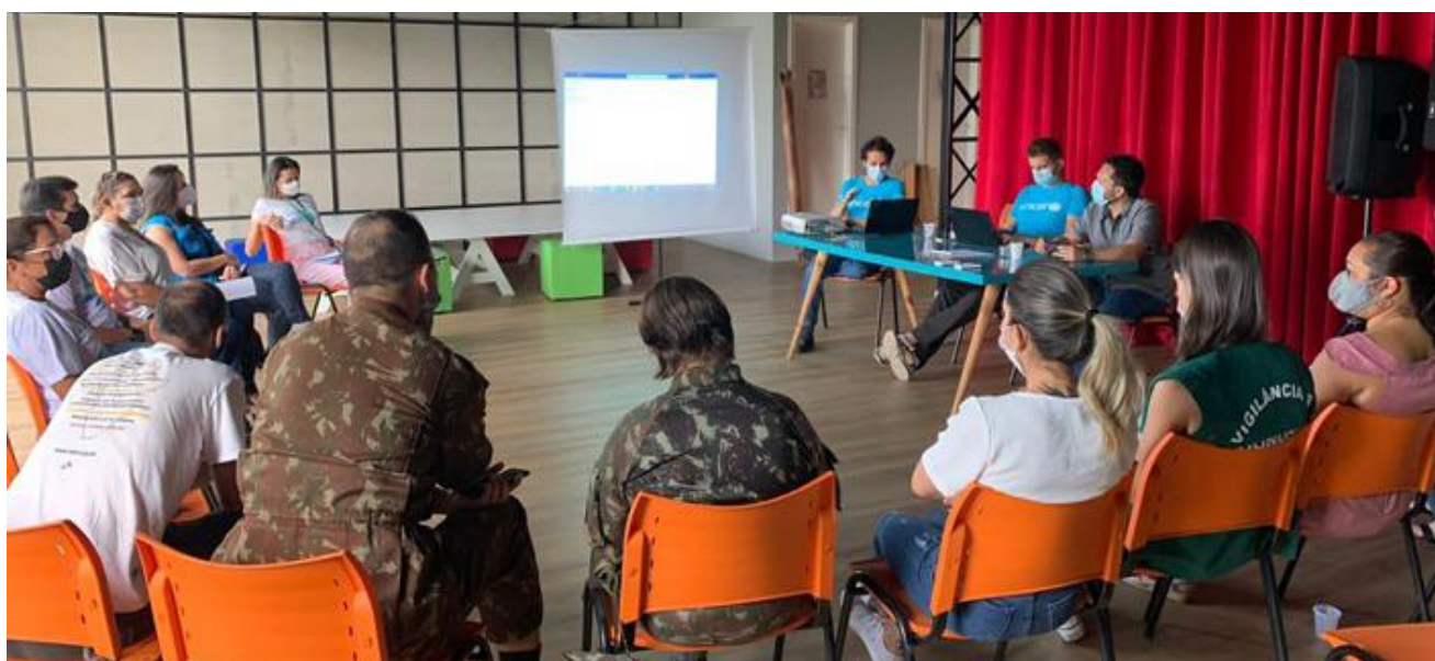
Reunião do GTWASH, com a participação de diversos atores-chave que atuam na Operação Acolhida, Boa Vista/RR – março, 2022.