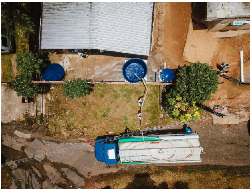
Abastecimento de água potável, via carro-pipa, no assentamento informal Aprisco, Boa Vista/RR – março, 2022.