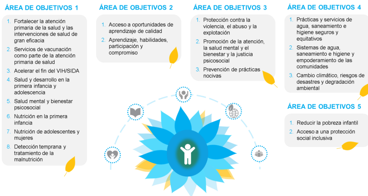
Gráfico II Esferas de resultados del Plan Estratégico para 2022-2025